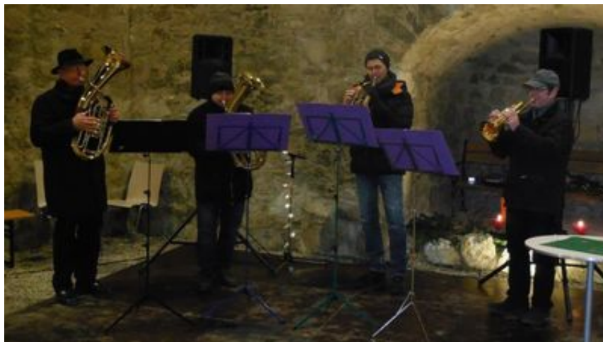
Adventstand im Schloss Esterhazy