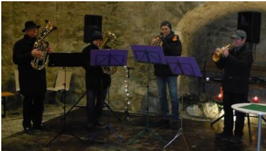
Adventstand im Schloss Esterhazy